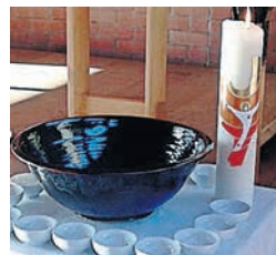
Tauferinnerung der Erstkommunionkinder

Mit den Kindern, die sich auf ihre Erstkommunion vorbereiten, feiern wir gemeinsam am Fest «Taufe des Herrn» am Sonntag, 9. Januar um 10.30 Uhr die Tauferinnerung.